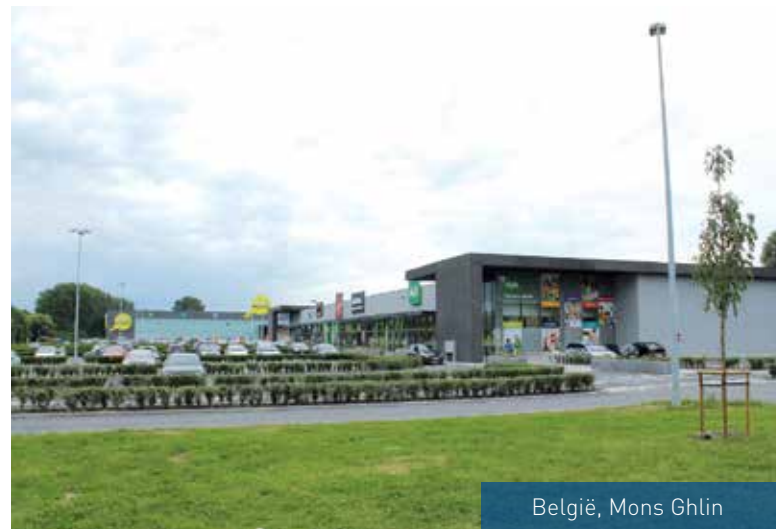
België, Mons Ghlin

Maar, winkels zijn dynamisch vastgoed. Wat vandaag "state of the art" is, kan morgen verouderd zijn. Daarom anticiperen we op veranderingen in het koopgedrag van de consument. We kopen onroerend goed aan, als we kansen zien dat beter te laten renderen, en stoten bezittingen af die niet meer in onze strategie passen. We passen panden aan zodat ze optimaal geschikt zijn voor onze huurders. We doen dat in voortdurende dialoog met retailorganisaties die als beste weten hoe zij hun klanten willen bedienen.