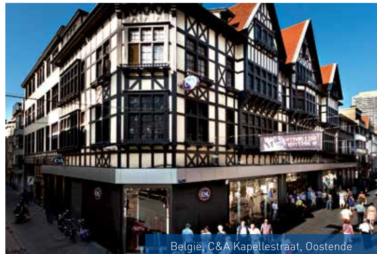
België, C&A Kapellestraat, Oostende

Als het de winkeliers goed gaat, gaat het ons ook goed