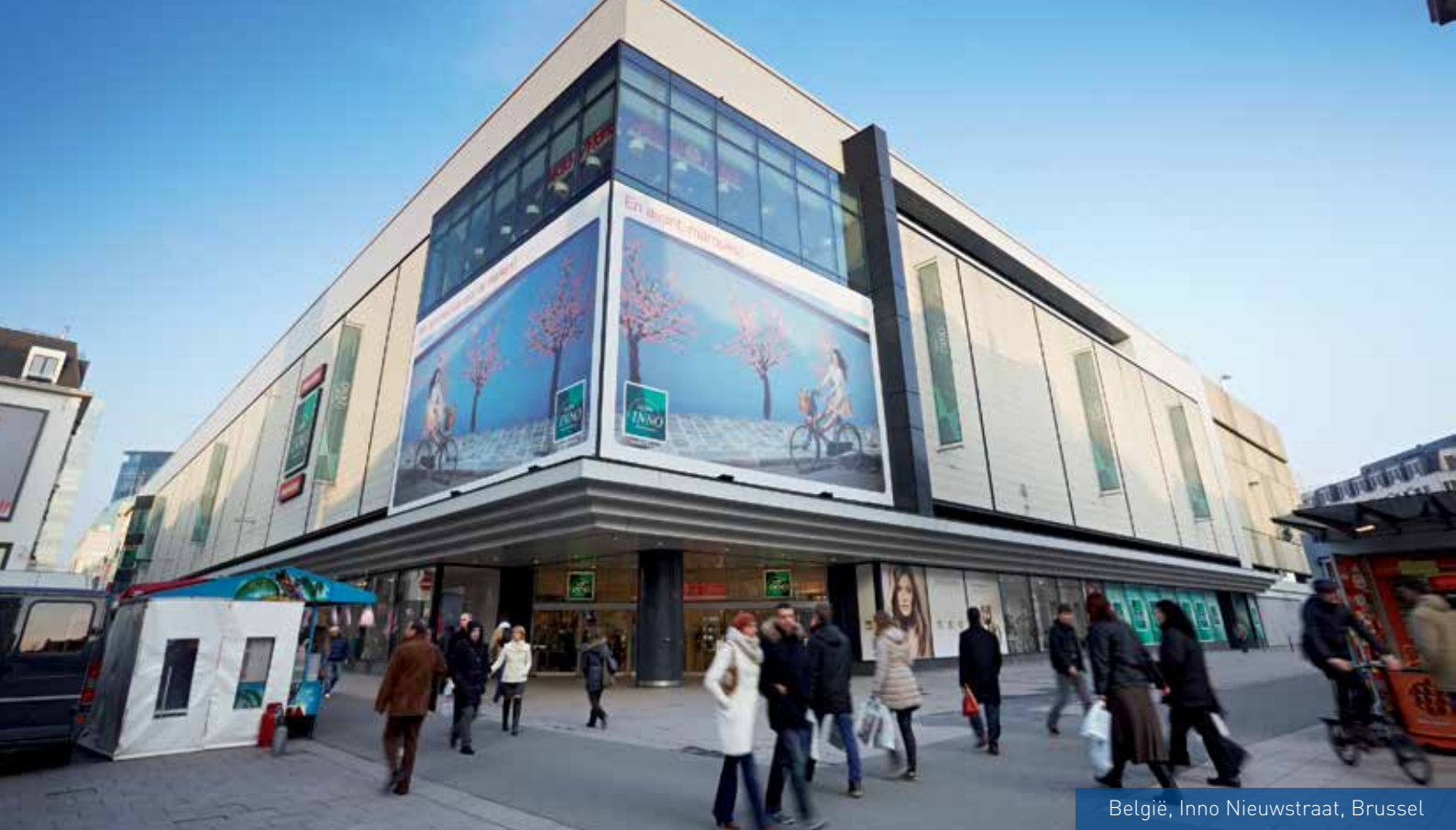
België, Inno Nieuwstraat, Brussel