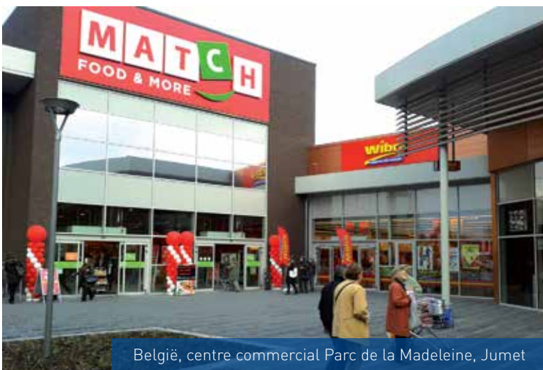
België, centre commercial Parc de la Madeleine, Jumez