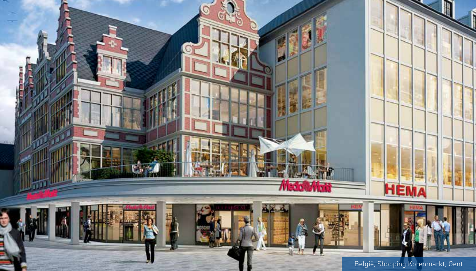
België, Shopping Korenmarkt, Gent

Maar, winkels zijn dynamisch vastgoed. Wat vandaag "state of the art" is, kan morgen verouderd zijn. Daarom anticiperen we op veranderingen in het koopgedrag van de consument. We kopen onroerend goed aan, als we kansen zien dat beter te laten renderen, en stoten bezittingen af die niet meer in onze strategie passen. We passen panden aan zodat ze optimaal geschikt zijn voor onze huurders. We doen dat in voortdurende dialoog met retailorganisaties die als beste weten hoe zij hun klanten willen bedienen.