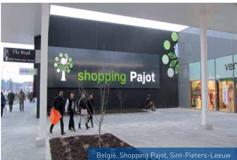
België, Shopping Pajot, Sint-Pieters-Leeuw

Redevco staat voor Real Estate Development Company. Redevco Belgium is sinds 1999 als zelfstandige vastgoedonderneming actief. In 2001 nam Redevco Belgium het vastgoed over van GIB Immo. Deze transactie had een waarde van ruim 1 miljard euro en bracht Redevco Belgium in de nationale top-5 van vastgoedinvesteerdere. In onze onderneming zijn twee activiteiten verenigd: vastgoedbeheer en vastgoed(her)ontwikkeling.