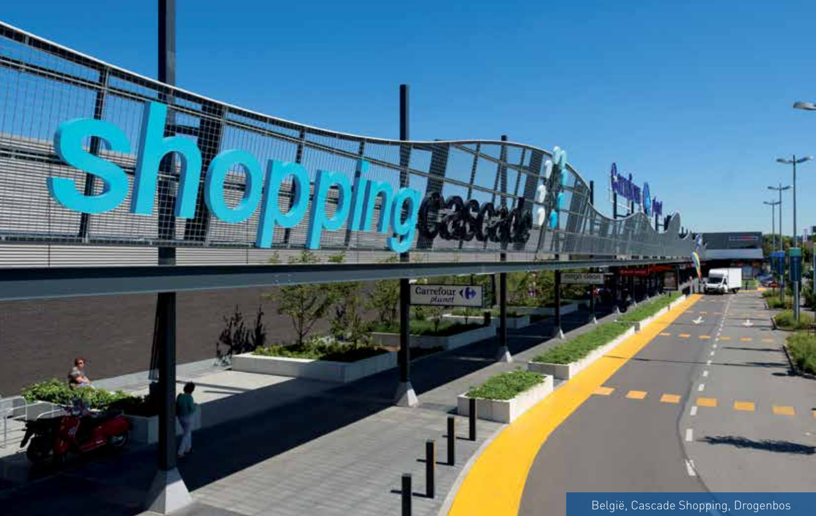
België, Cascade Shopping, Drogenbos

Met een netto belegd vermogen van 1,760 miljard euro is Redevco Belgium één van de belangrijkste investeerders op de Belgische vastgoedmarkt. Op het gebied van winkelruimte zijn we zelfs koploper, met 271 objecten op 168 locaties. De totale bruto verhuurbare oppervlakte in onze portefeuille is 1,6 miljoen m 2 , het totale grondbezit 4,8 miljoen m 2 . In 2013 was 99,4% van de portefeuille verhuurd. De minimale leegstand is een goede graadmeter voor de kwaliteit van onze portefeuille. Het meeste van ons vastgoed bevindt zich in Vlaanderen (50%). Zo'n 28% bevindt zich in Wallonië en 22% in Brussel. Hyper-/supermarkketens en kledingzaken zijn de belangrijkste huurders. Ook doe-het-zelfzaken, elektro-zaken en warenhuizen zijn grote huurders. Dankzij de overname van GIB Immo is het huurdersbestand zeer gevarieerd.